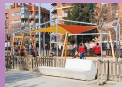
Toldos en los juegos infantiles junto a la escuela Edelweiss.