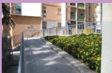
Rampas para mejorar la accesibilidad entre la c/ Bambú y la plaza Antonio Machado.