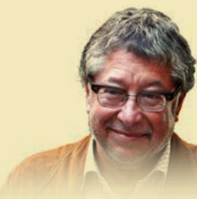
L'alcalde Antonio Balmón