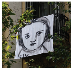
WHY? Obra de Carme Solé Vendrell