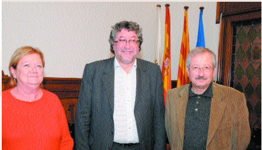
L'alcalde i els portaveus dels grups que formen part de l'equip de govern durant l'aprovació del pressupost de 2009.

Un presupuesto en 2009 de 1.590 euros en la ciudad por habitante